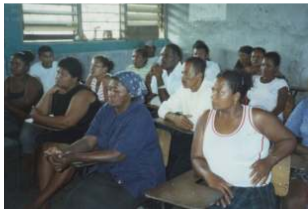
Reunión de trabajo con habitantes de la comunidad de Benk, Municipio Villeda Morales.

Los esfuerzos y acciones anteriores fueron apoyados mediante la aplicación de una