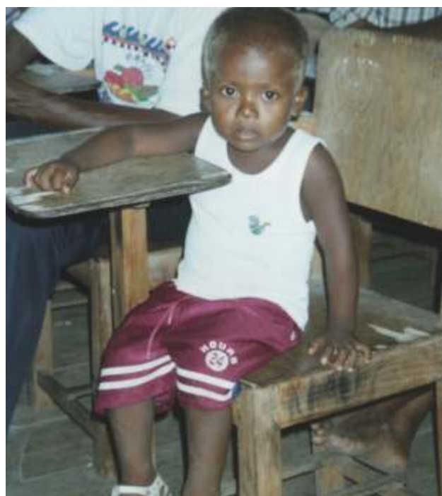
Niño misquito, residente en la comunidad de Titi, Municipio Villeda Morales.

Los Objetivos Inmediatos y los Resultados Esperados