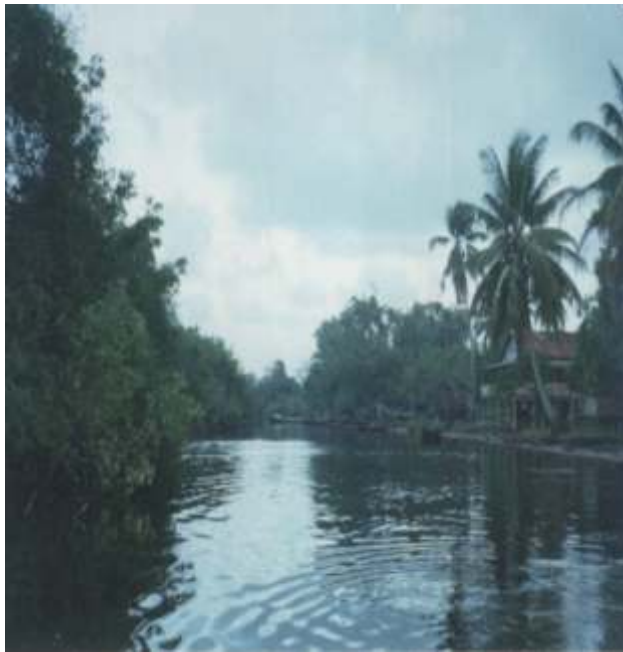
Canal Fluvial en Raya, una comunidad del Municipio Villeda Morales.

rurales, a saber: Pakwi; Tusidaksa; Karaswatla; Benk; Titi; Raya; Rayamuna; Klubki; Klubkimuna; Mangotara; Kasautara; Kruta; Wangkiawala e I rlaya.